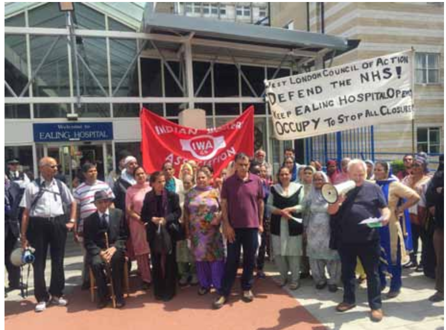
ਹਿੱਸਾ ਲਿਆ ਸੀ ਅਤੇ ਇਸ ਜਾਇਜ਼ ਸੰਘਰਸ਼ ਵਿੱਚ ਮਜ਼ਦੂਰਾਂ ਨੂੰ ਵੱਡੀ ਗਿਣਤੀ ‘ਚ ਲਾਮਬੰਦ ਕਰਨ ਦੀ ਆਪਣੀ ਦ੍ਰਿੜਤਾ ਜਾਹਰ ਕੀਤੀ ਸੀ। ■

ਮਜ਼ਦੂਰ ਏਕਤਾ ਲਹਿਰ ਦੇ ਪ੍ਰਤੀਨਿਧ ਨਾਲ ਫੋਨ ‘ਤੇ ਗੱਲ ਕਰਦਿਆਂ, ਇੰਡੀਅਨ ਵਰਕਰਜ਼ ਐਸੋਸੀਏਸ਼ਨ ਦੇ ਬੁਲਾਰੇ ਨੇ ਕਿਹਾ ਕਿ ਇਸ ਪ੍ਰੋਗਰਾਮ ਦੀ ਸਫਲ ਸ਼ੁਰੂਆਤ ਨਾਲ ਲੋਕਾਂ ਵਿੱਚ ਕਾਫੀ ਜੋਸ਼ ਹੈ। ਇੰਡੀਅਨ ਵਰਕਰਜ਼ ਐਸੋਸੀਏਸ਼ਨ ਦੇ ਕਾਰਜਕਰਤਾ, ਲੋਕਾਂ ਨੂੰ ਧਰਨੇ ‘ਚ ਹਿੱਸਾ ਲੈਣ ਅਤੇ ਇਸ ਦੀ ਹਮਾਇਤ ਕਰਨ ਲਈ ਉਤਸ਼ਾਹਿਤ ਕਰਨ ਲਈ ਪੂਰਾ ਜੋਰ ਲਾ ਰਹੇ ਹਨ। ਉਸਨੇ ਦੱਸਿਆ ਕਿ 17 ਜੂਨ ਨੂੰ ਈਲਿੰਗ ਵਿੱਚ ਵੈਸਟ ਲੰਡਨ ਕਾਂਉਂਸਲ ਆਫ ਐਕਸ਼ਨ ਵਲੋਂ ਸੱਦੀ ਗਈ ਜਨਤਕ ਸਭਾ ਵਿੱਚ ਇਸ ਮੁਜ਼ਾਹਰੇ ਅਤੇ ਧਰਨੇ ਨੂੰ ਜਥੇਬੰਦ ਕਰਨ ਦਾ ਫੈਸਲਾ ਲਿਆ ਗਿਆ ਸੀ। (ਨੋਟ ਇਸ ਫੈਸਲੇ ਬਾਰੇ ਜਾਰੀ ਕੀਤੀ ਗਈ ਪ੍ਰੈਸ ਰੀਲੀਜ਼ ਬਾਕਸ ਵਿੱਚ ਦੇਖੋ)। ਉਸ ਸਭਾ ਵਿੱਚ ਸਾਰੇ ਹੀ ਬੁਲਾਰਿਆਂ ਨੇ ਕਿਹਾ ਸੀ ਕਿ ਈਲਿੰਗ ਹਸਪਤਾਲ ਦੇ ਜਣੇਪਾ ਵਾਰਡ ਨੂੰ ਬੰਦ ਹੋਣ ਤੋਂ ਬਚਾਉਣਾ ਉਨ੍ਹਾਂ ਦਾ ਅਧਿਕਾਰ ਹੈ ਅਤੇ ਕਰਤੱਵ ਵੀ ਹੈ। ਇੰਡੀਅਨ ਵਰਕਰਜ਼ ਐਸੋਸੀਏਸ਼ਨ ਨੇ ਉਸ ਸਭਾ ਵਿੱਚ ਸਰਗਰਮੀ ਨਾਲ